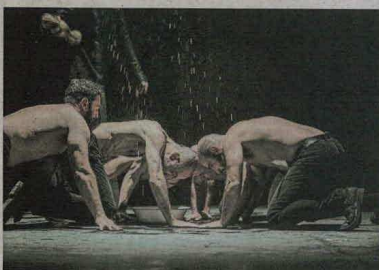
Una escena un poco minimalista sirve de contexto para esta reflexión acerca de lo humano y sobrenatural que plantea la obra.

ES LA COMPAÑÍA TEATRAL QUE DESARROLLÓ ‘MACBETTU’